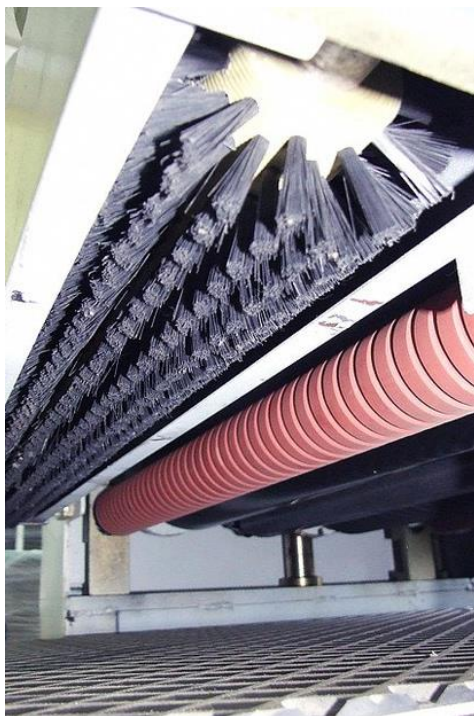
Щёточный барабан для удаления древесной пыли с поверхности заготовки

420095, г. Казань, ул. Восстания 100к220 ИНН 2130193195 КПП 213001001 ОГРН 1172130013725