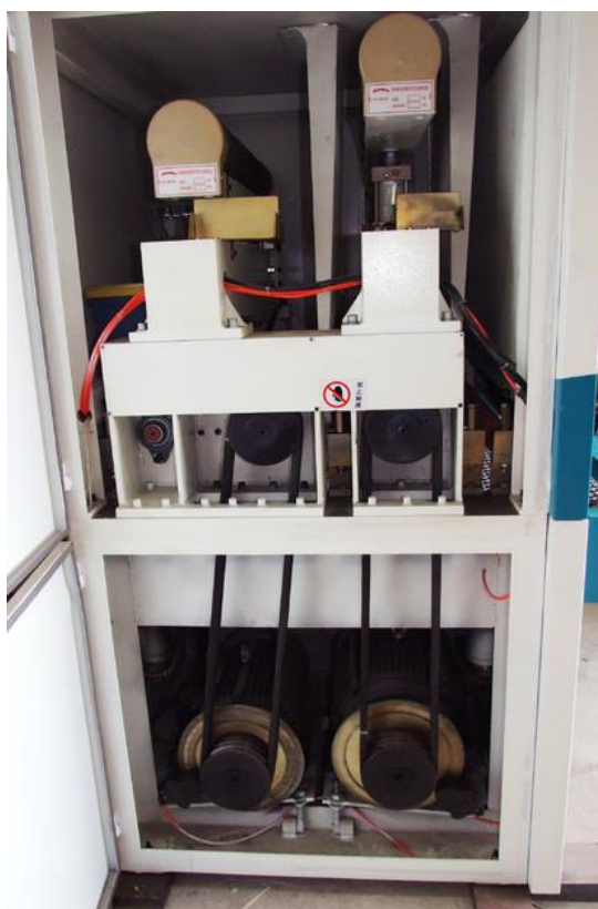
Раздельный привод каждого узла.